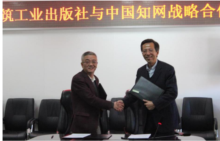
同方知网与中国建筑工业出版社共同签署战略合作协议

多元化产品合作开发等方面达成了深度的合作共识，并于会上举行了战略合作签约仪式，同时签署数字出版物国际营销代理协议，正式推动中国学术典藏图书库英文版及中国建筑专题库（ArchChina）两种国际产品上线。